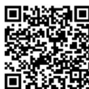
关注“克拉玛依日报”微信公众号,第一时间传递街拍图片和新闻线索