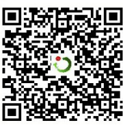
嗨克拉玛依客户端 扫一扫二维码,掌握生活