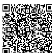
扫一扫二维码为老师送祝福