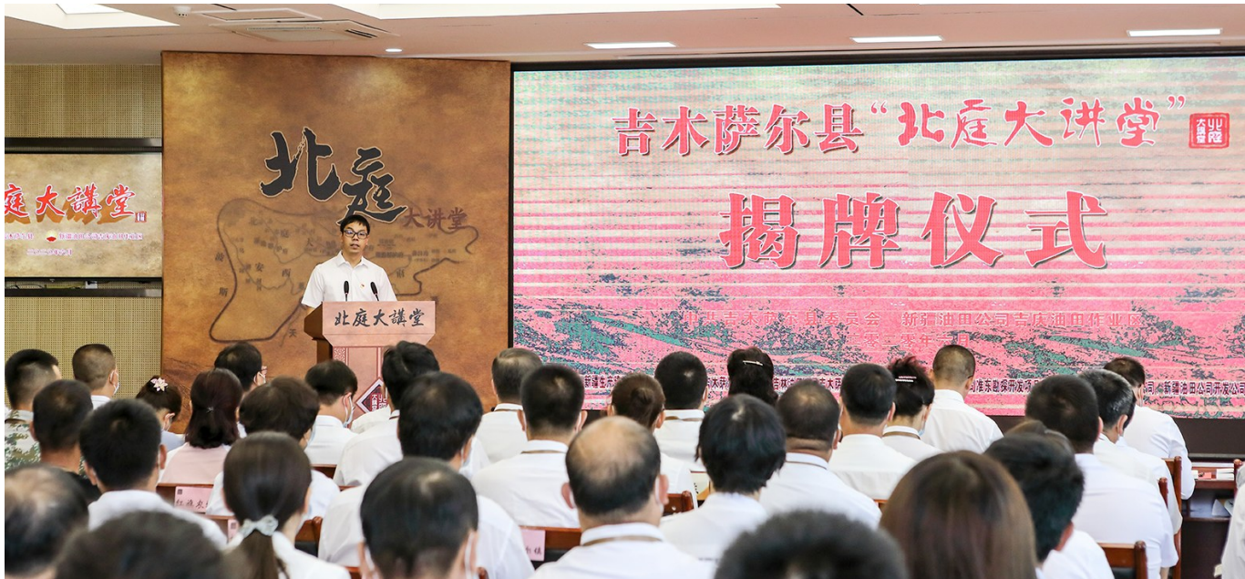
6月12日,“北庭大讲堂”揭牌仪式现场。

据了解,“北庭大讲堂”创办之后,将邀请各个领域的专家学者前来讲学分享,通过思想交流、学术交流,不断拓宽职工视野,加深企地融合,造福职工群众,力争把“北庭大讲堂”打造成为新疆油田分公司一张展示激情创业、展示历史文化、展示企地融合的闪亮名片。